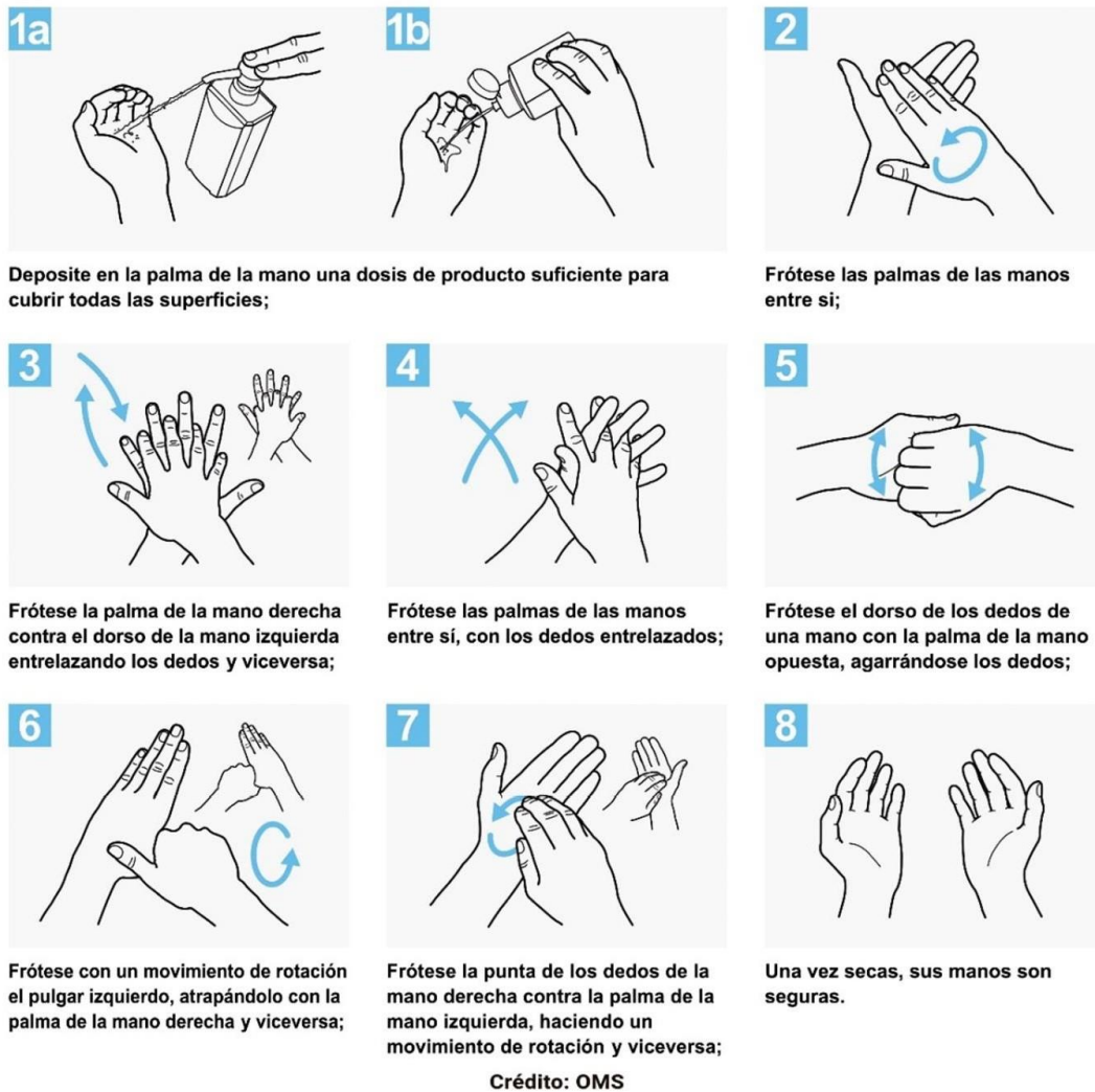
Figura 2: Método adecuado para el uso de soluciones a base de alcohol

Las personas que manipulen los alimentos deberán lavarse las manos al menos por 40-60 segundos con agua y jabón (Figura 1) o por 20-30 segundos con soluciones a base de alcohol (Figura 2):